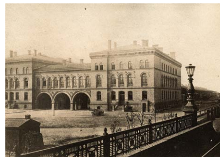
© SDTB, Historisches Archiv, Sig. II..1984

Text: Nico Kupfer Redaktionsstand: August 2015