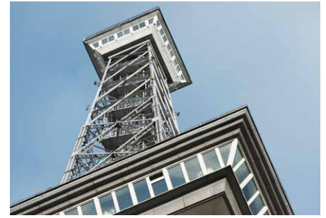
Restaurant und Aussichtsplattform

Orientierungshilfe für die Berlin anfliegenden Flugzeuge. Am 19. August 1935 kam es zu einem Brand in der Funkhalle. Die große Hitze führte zu einem Kurzschluss an den Installationen des Funkturms, was wiederum zu einem Feuer an der Ostseite des Küchen- und Restaurantbereichs führte. Der Schaden am Restaurant konnte zwar beseitigt werden. Der Funkturm verlor aber vorübergehend seine namensgebende Funktion: das Funken. Denn mit dem Bau des Hauses des Rundfunks erhöhte sich der Sendebetriebs, der Funkturm war als Sendemast nicht mehr ausreichend. Ende des Zweiten Weltkrieges brachte ein Granatfeuer das gesamte Bauwerk des Funkturms fast zum Einsturz. Aus diesem Grund wurde kurzzeitig sogar ein Abriss des beliebten Wahrzeichens in Betracht gezogen. Man entschied sich jedoch für die Reparatur, und der Funkturm erhielt sogar wieder seine alte Funktion, wenn auch in weniger bedeutsamer Form. Seit 1961 steht der Funkturm unter Denkmalschutz.