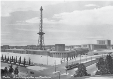
Historische Postkarte