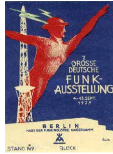
© Stiftung Deutsches Technikmuseum Berlin, Entwurf: Fritz Werbemarke Funkausstellung 1925